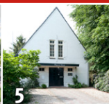
5 Doopsgezinde Gemeente