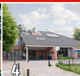
4 De Blinkert