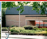
7 Apostolisch Genootschap